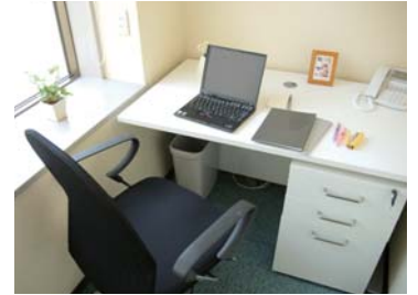
個室 Private room