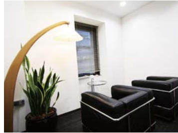
リフレッシュコーナー Refreshment corner