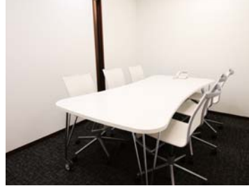
商談室 Business talk room