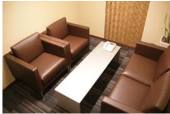
応接室 Reception room