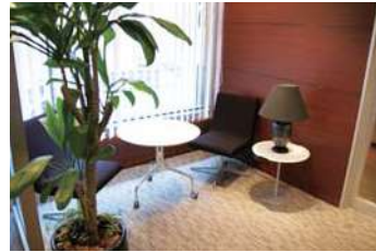
エントランスホール Entrance hall