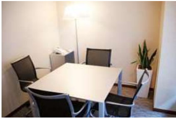
商談室 Business talk room