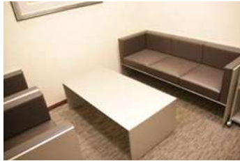
応接室 Reception room