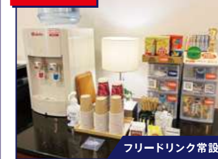
フリードリンク常設