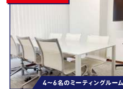
4~6名のミーティングルーム